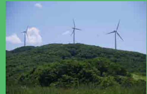
万太郎山の風力発電